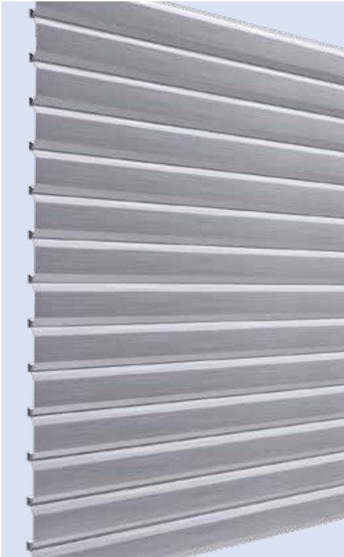
Außenansicht Profil 1110