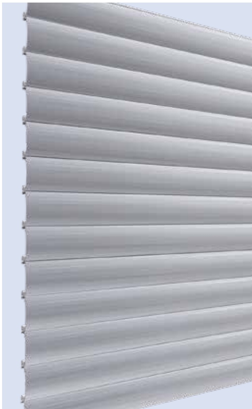
Außenansicht Profil 7510

Stabiles Profil für kleine bis mittelgroße Toranlagen: stranggepresst, für vielseitige Einsatzzwecke