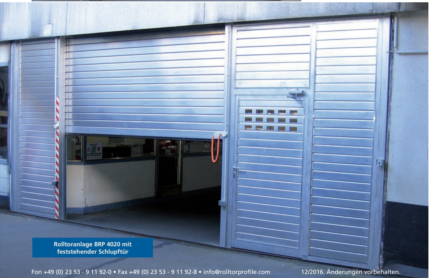
Rolltoranlage BRP 4020 mit feststehender Schlupftür