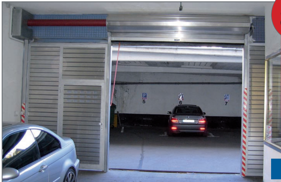
Rolltoranlage BRP 4020 mit feststehender Schlupftür

Sie benötigen eine technische Zeichnung Ihrer Toranlage? Kein Problem! Wir können Ihnen Zeichnungen in allen gängigen Formaten zur Verfügung stellen.