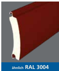
ähnlich RAL 3004