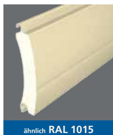
ähnlich RAL 1015