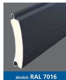
ähnlich RAL 7016