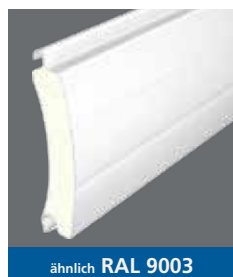
ähnlich RAL 9003