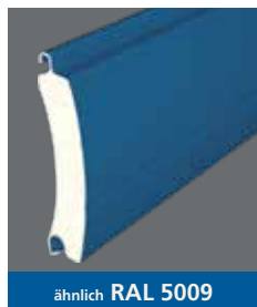
ähnlich RAL 5009