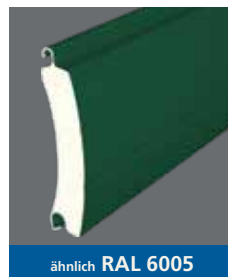
ähnlich RAL 6005