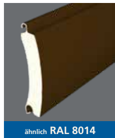
ähnlich RAL 8014