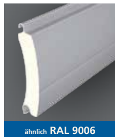
ähnlich RAL 9006