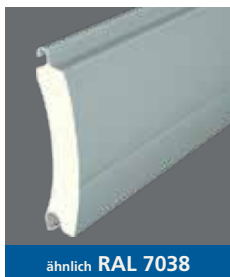
ähnlich RAL 7038