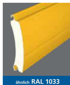
ähnlich RAL 1033