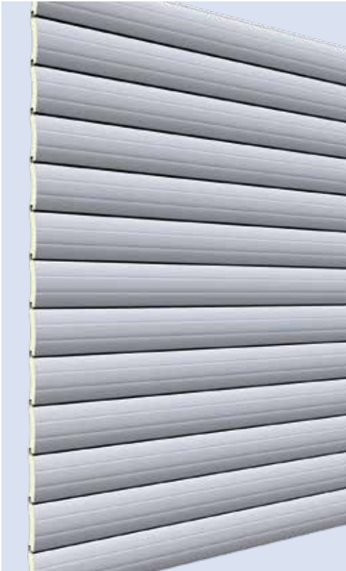
Außenansicht Profil 7520 (ähnlich RAL 9006)