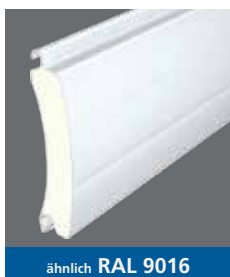
ähnlich RAL 9016